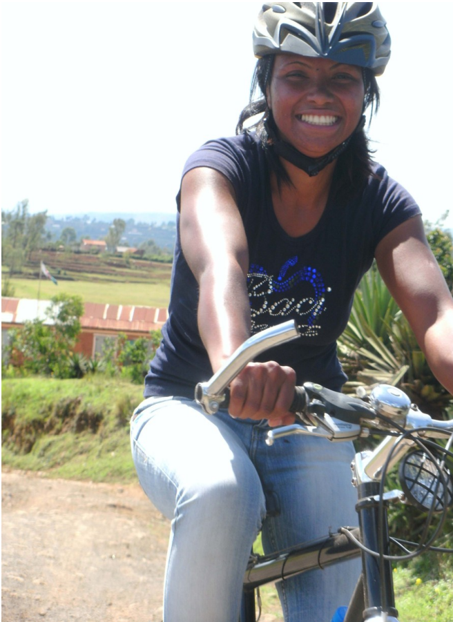
Radeln im Hochland

Während der touristischen Hochsaisons arbeitest Du einige Monate ohne zu unterbrechen. In anderen Monaten hast Du mehr Zeit für Deine Familie und Deine Hobbys. Erzähle und bitte in ein paar Worten wie Du dann Deine Zeit verbringst.